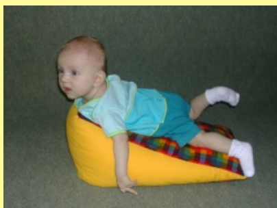
10.1.37.2 Klínová opěrka II.