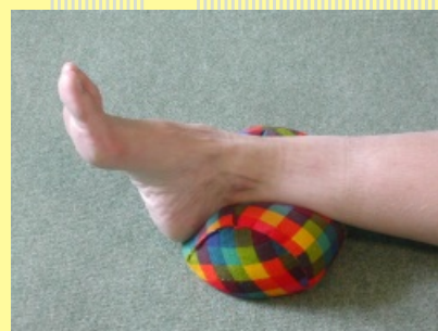
10.1.6.2 Váleček na ruku III.