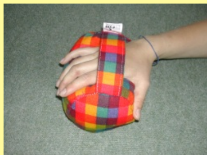
10.1.6.2 Váleček na ruku I.