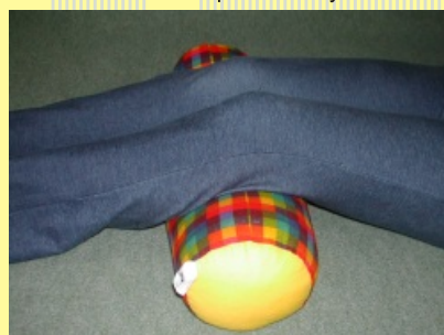
10.1.5.2 Válec I.