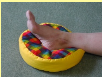
10.1.2.2 Kruhová podložka vysoká II.