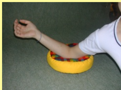
10.1.2.2 Kruhová podložka vysoká I.