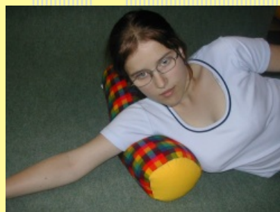
10.1.5.2 Válec IV.