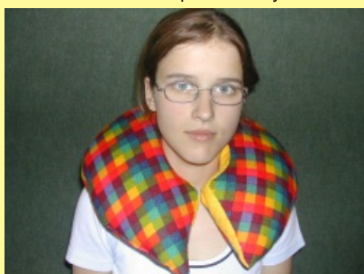
10.1.11.2 Otevřený kruh na krk