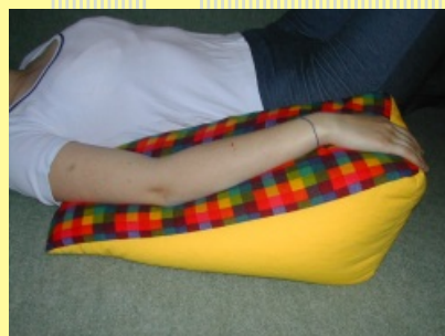
10.1.8.2 Klínová opěrka III..

Zdravotnická technika pro nemocnice, domovy důchodců, ústavy sociální péče, agentury domácí péče, penziony a ostatní klienty.