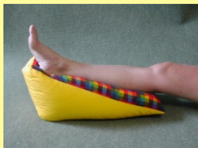
10.1.9.2 Klínová opěrka I.