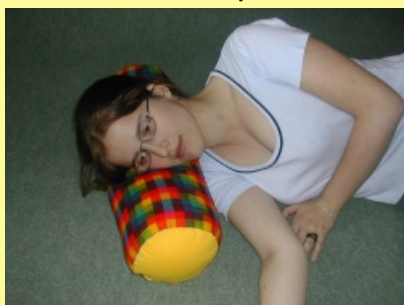
10.1.5.2 Válec III.