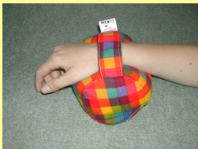
10.1.6.2 Váleček na ruku II.