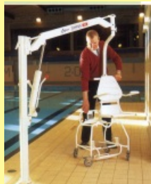
Bazénový zvedák DIPPER s příslušenstvím