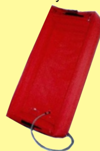
Čtyřkomorová domácí vana